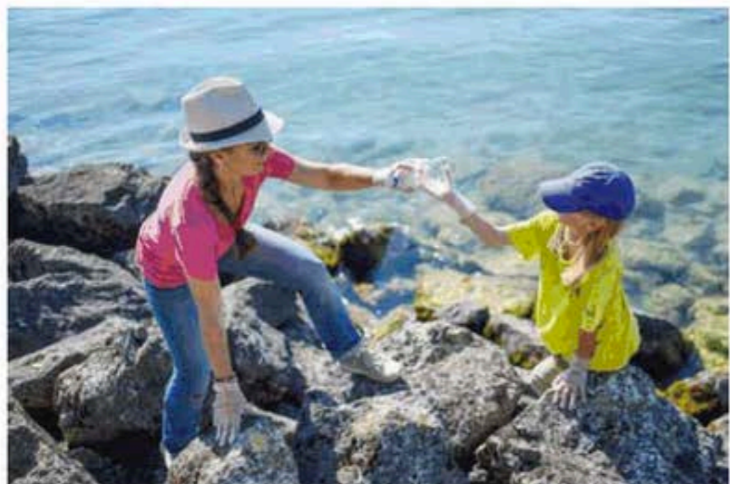
Accompagnés par des adultes, les plus petits n'ont pas rechigné à la tâche.