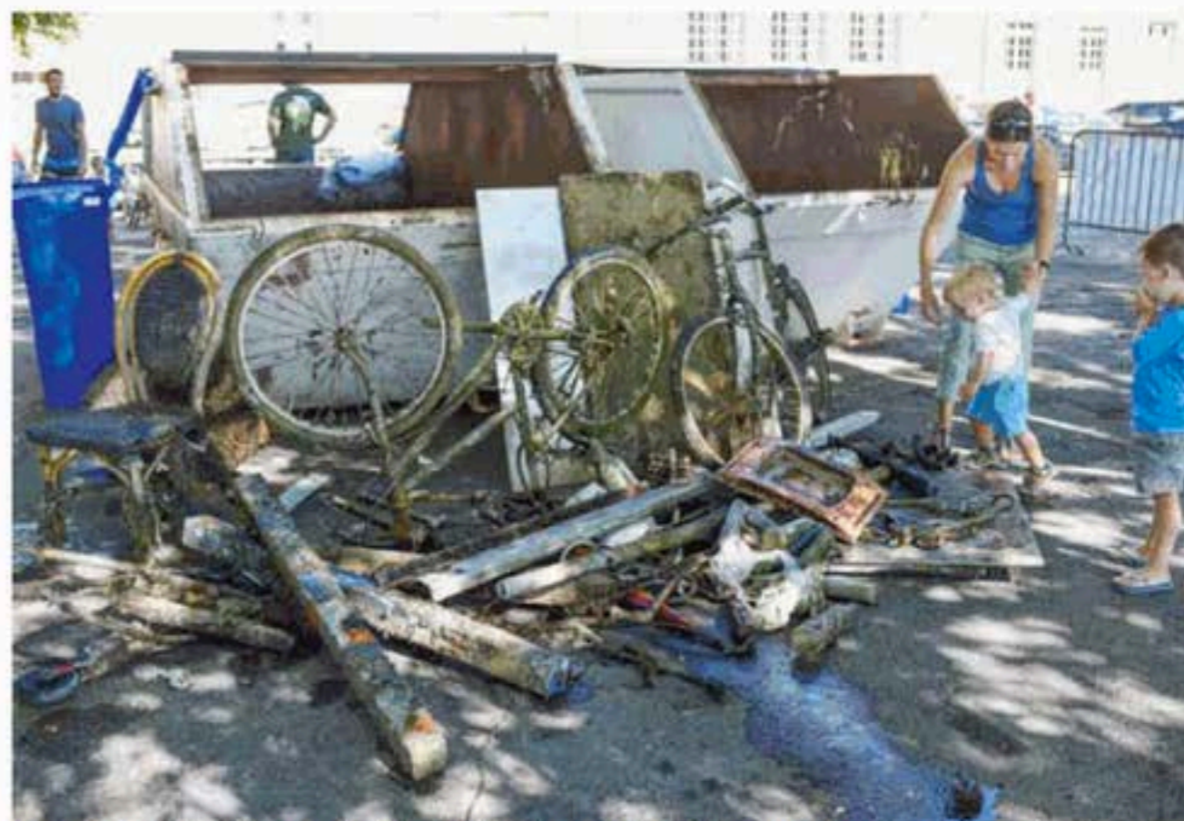
Quelques-uns des objets extraits du lac par les plongeurs de PurLac: un capharnaüm révélateur.